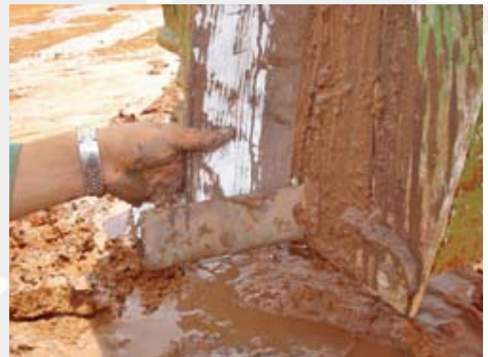
Figura 5 - Detalle de la puntera metálica presa al geodren.

Apropiadas para prender la fita a la lanza, protegerla durante el proceso de clavado y fijarla al final del hueco (Figura 5).