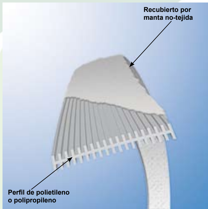
Figura 1 - Ejemplo de geodren.

El método es el de clavado de membranas plásticas, con cerca de 10 cm de largo por 5 mm de espesor, envueltas por geomembranas (Figura 1). El clavado es hecho por medio de barras verticales, que pueden atingir cerca de 30 metros de profundidad (Figura 2). Se sigue con la aplicación de aterro provisorio, de sobrecarga.