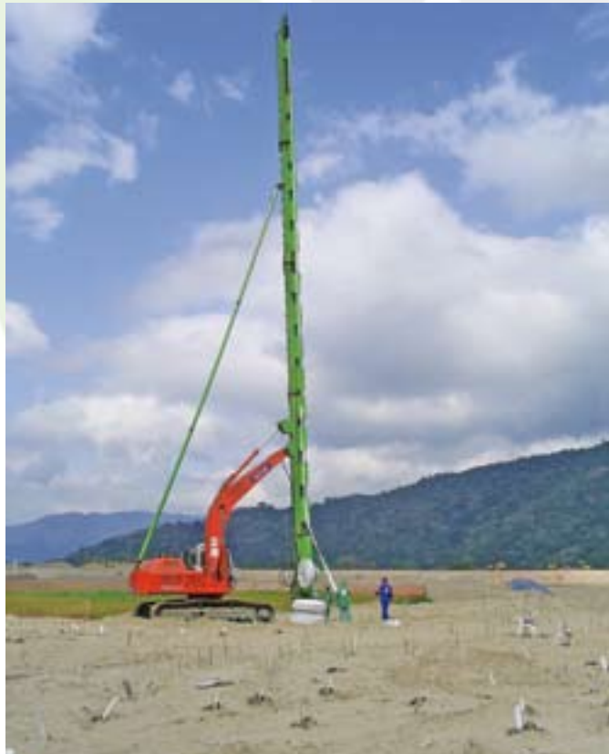
Figura 4 - Equipamiento en servicio de clavado de geodrenes.

El proceso es simple y rápido. El geodren es introducido en el interior de la lanza de clavado hasta su extremidad inferior, donde es preso a una puntera metálica especial. En seguida, la lanza es accionada para abajo,